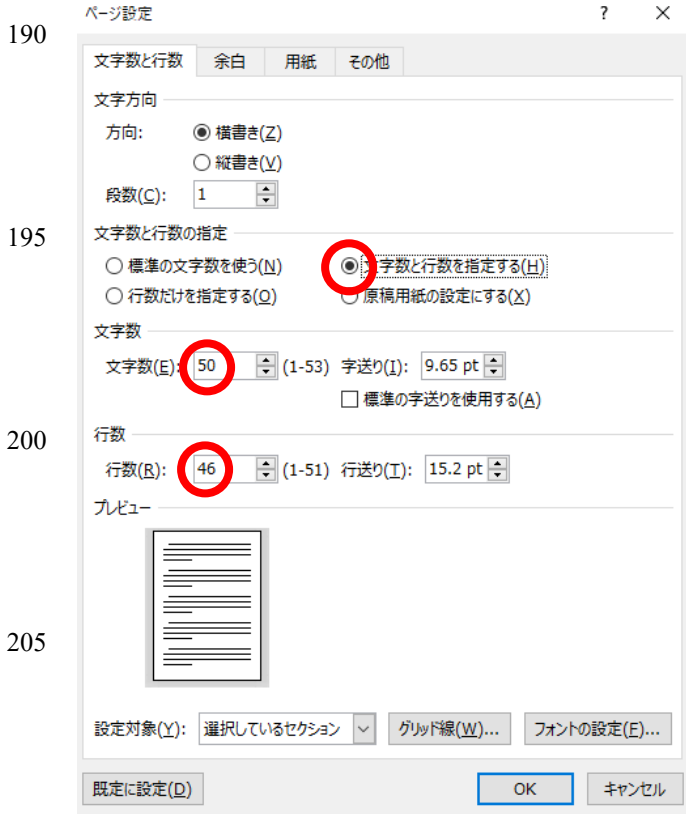
図 1 ページ設定:文字数と行数