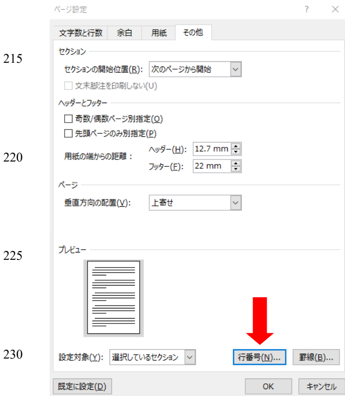
図 3 ページ設定:「その他」のタブから行番号設定へ